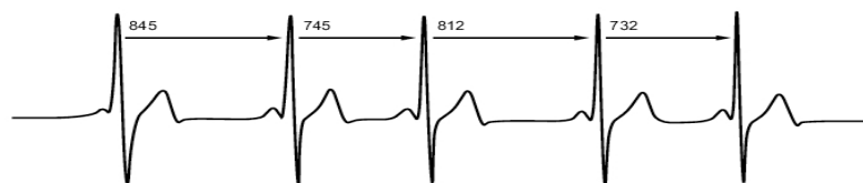
Abbildung 1 : EKG zur Darstellung der variablen Abstände zwischen den einzelnen Herzschlägen

Die Herzratenvariabilität oder auch Herzfrequenzvariabilität genannt, ist der variable Abstand zwischen den einzelnen Herzschlägen. Im EKG ist dies durch die R-Zacke bzw. den Abstand zwischen zwei R-Zacken gegeben, was in Abbildung 1 dargestellt ist. Der Abstand zwischen zwei R-Zacken wird RR-Intervall genannt (7).